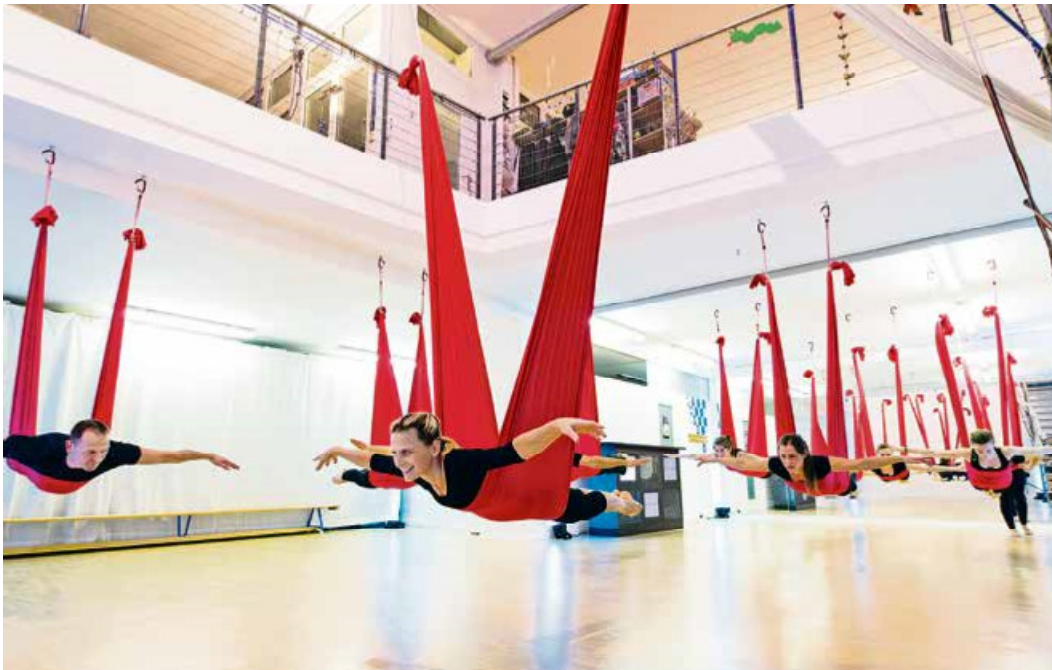
Im oberen Teil ist der Wohnbereich, unten trainieren die Artisten täglich und geben Kurse, zum Beispiel Tuch-Yoga.