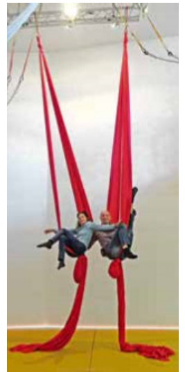
Der Raum ist sieben Meter hoch.