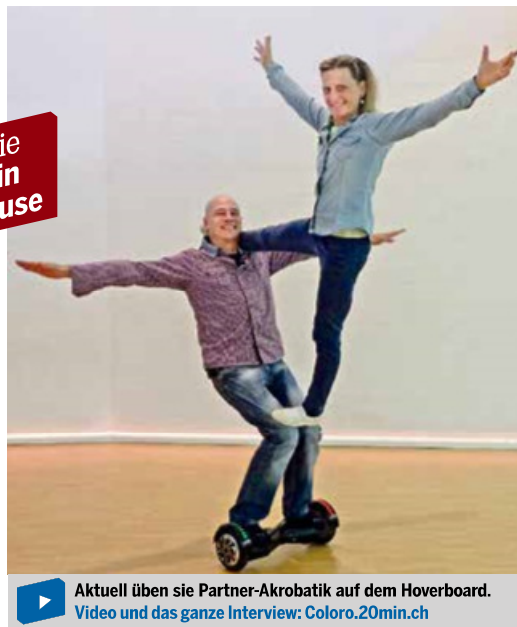
Aktuell üben sie Partner-Akrobatik auf dem Hoverboard. Video und das ganze Interview: Coloro.20min.ch

einziehen. Seid ihr oft auf Tournee? Matter: Nachdem wir früher oft im Ausland tourten, konzentrieren wir uns mittlerweile